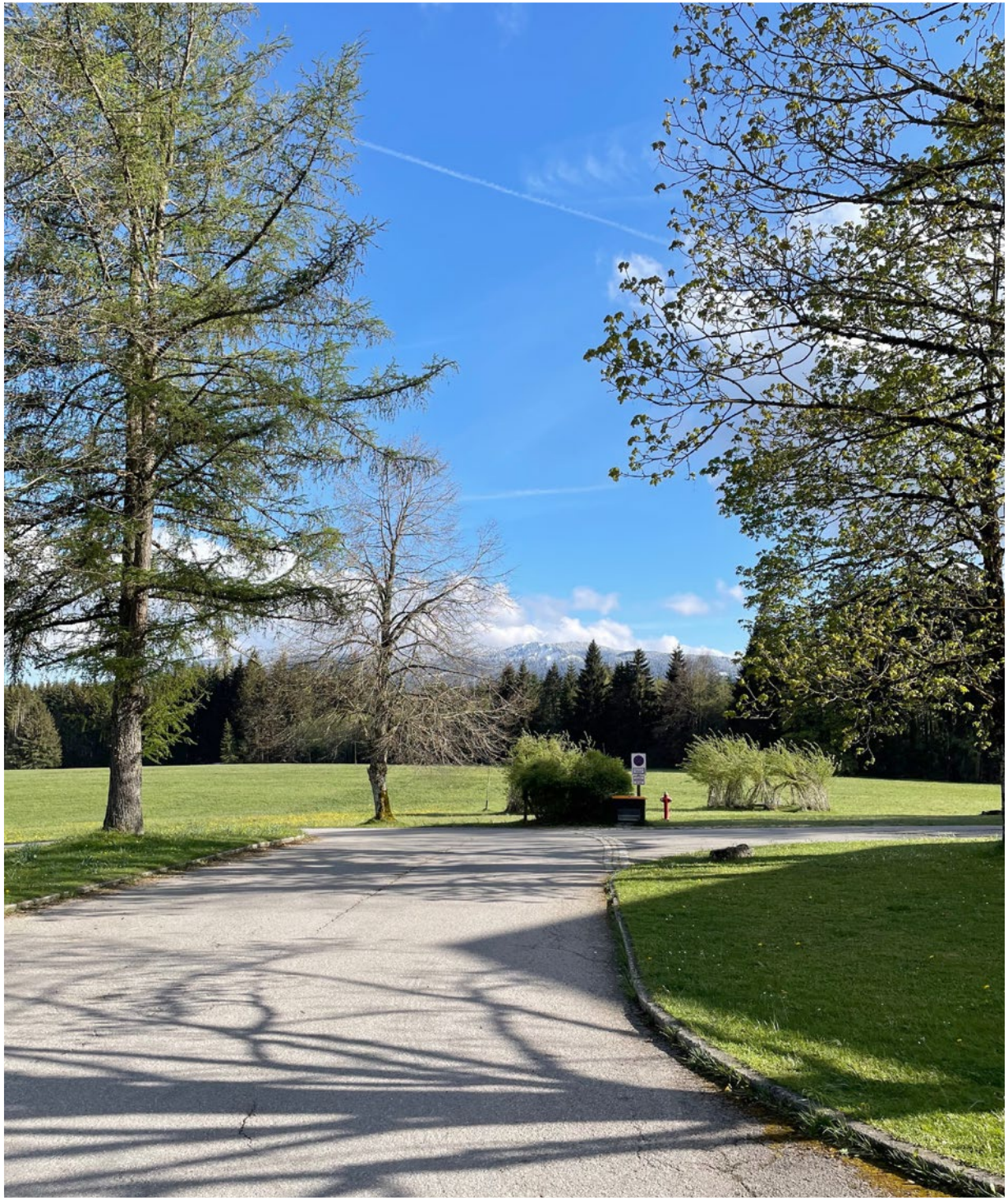
„DIAKONISCHE UND KIRCHLICHE SPUREN IN DER LANGAU.“ MARKUS EBINGER