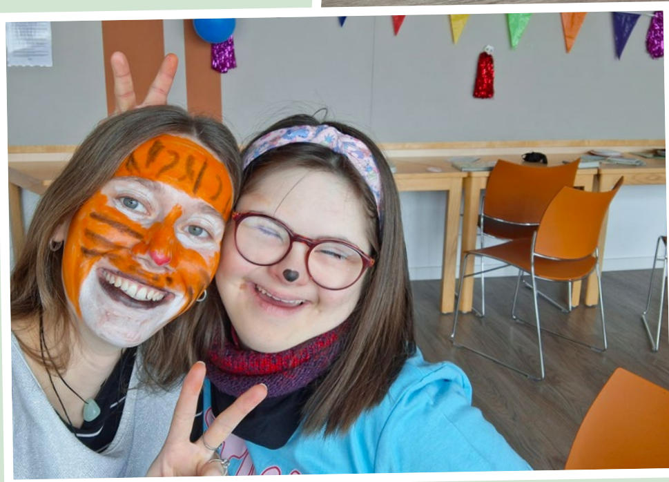
Hand in Hand, Vielfalt, die verbindet