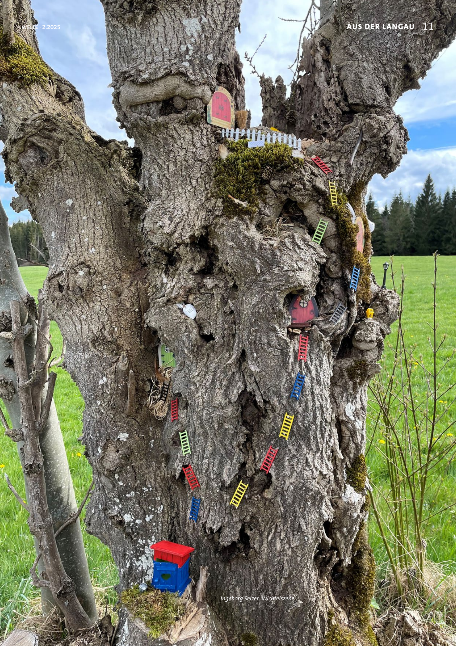
Ingeborg Selzer: Wichtelszene