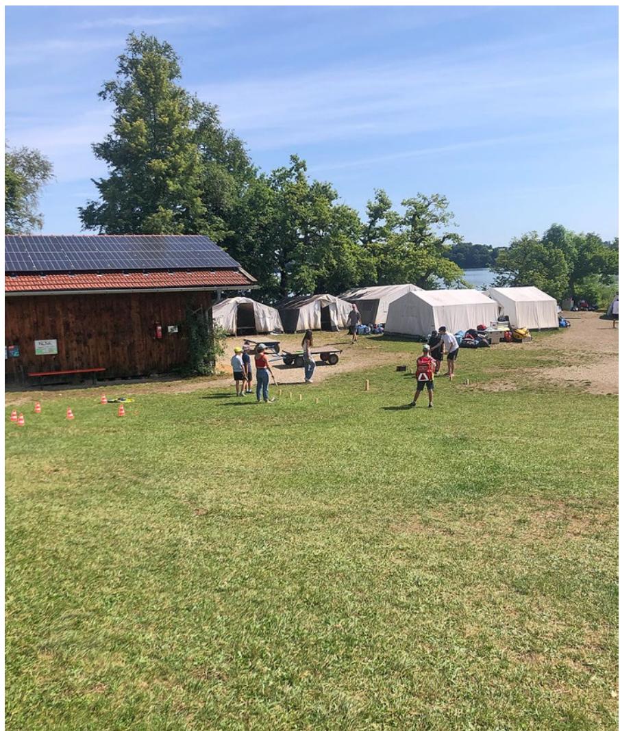
„Rounder“ – ein Mannschaftsspiel für alle