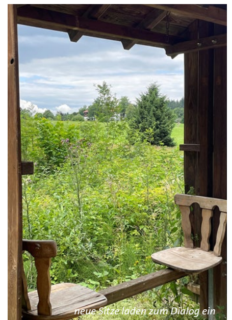
neue Sitze laden zum Dialog ein