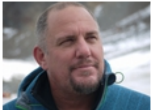
Fachstelle Väter von Kindern mit Behinderung, Langau